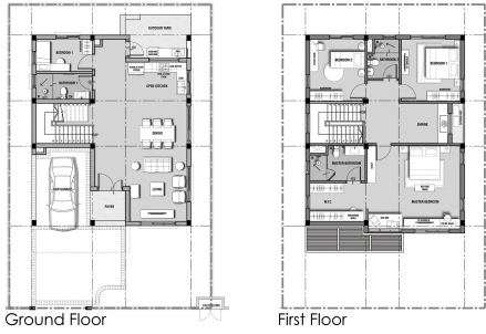
Padauk Garden Villas

Padauk Garden Villas သည် ၄၀'x ၆၀' မြေနေရာအကျယ်အဝန်းအပေါ်တွင် လှပတင့်တယ်စွာတည်ဆောက်ထားသော နှစ်ထပ်အိမ်လေးဖြစ်ပါသည်။ အိမ်၏ မြေညီထပ်တွင် တစ်ယောက်အိမ်ခန်း (၁) ခန်း၊ ဘုရားကျောင်း (၁) ခန်းနှင့် အစွင့်ပုံစံမီးဖိုချောင်အိမ်ခန်း တည်ဆောက်ထားပြီး ခြံစည်းထားပြီး အိမ်၏အနောက်ဘက်တွင် လည်း အပြင်ဘက် မီးဖိုချောင် ခြံလှုပ်ရန်နေရာတစ်ခုကိုပါ ခြံစည်းပေးထားပါသည်။ အိမ်၏ပထမထပ်တွင် ချောချောချောချောပါဝင်သော အိမ်နား၊ ကျယ်ဝန်းသည့်မိသားစု အိမ်ခန်း (၁)ခန်း၊ တစ်ယောက်အိမ်ခန်း (၂) ခန်း၊ ဘုရားကျောင်း (၁)ခန်း တို့ပါဝင်သည့်အပြင် ဘုရားခန်း (၁) ခန်း၊ စားခန်းအပြင်အသုံးပြုရန်လှည့်နေရာတို့ပါ ထည့်သွင်းခြံစည်းပေးထားပါသည်။