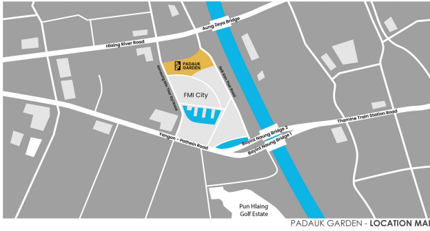
PADAUK GARDEN - LOCATION MAP